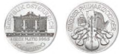
1 Unze Pt