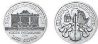
1 Unze Ag